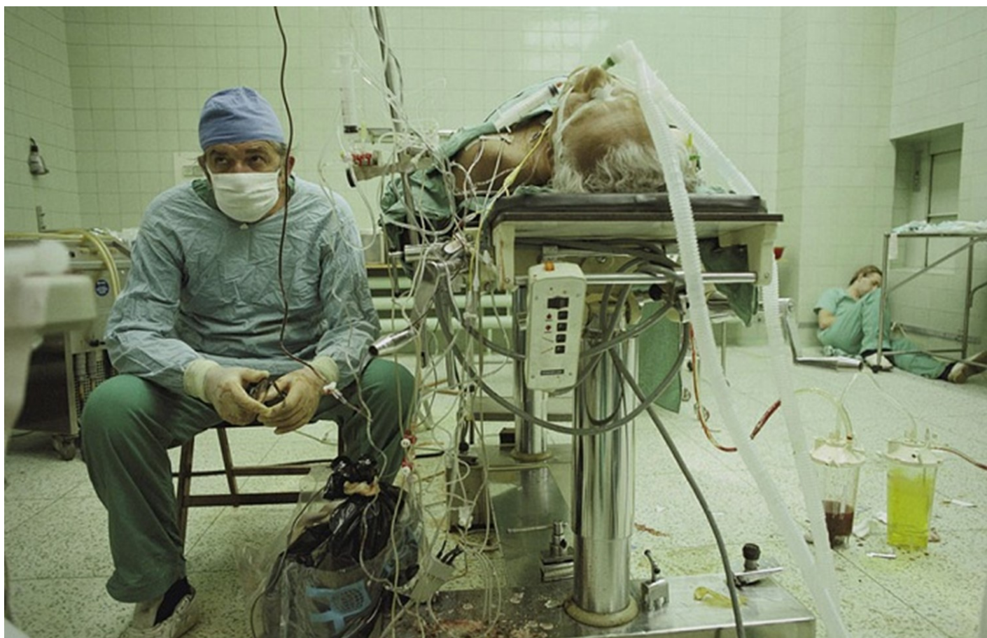
ניתוח השתלת לב שנמשך 23 שעות (ועבר בהצלחה). האסיסטנטית ישנה בפינת החדר.