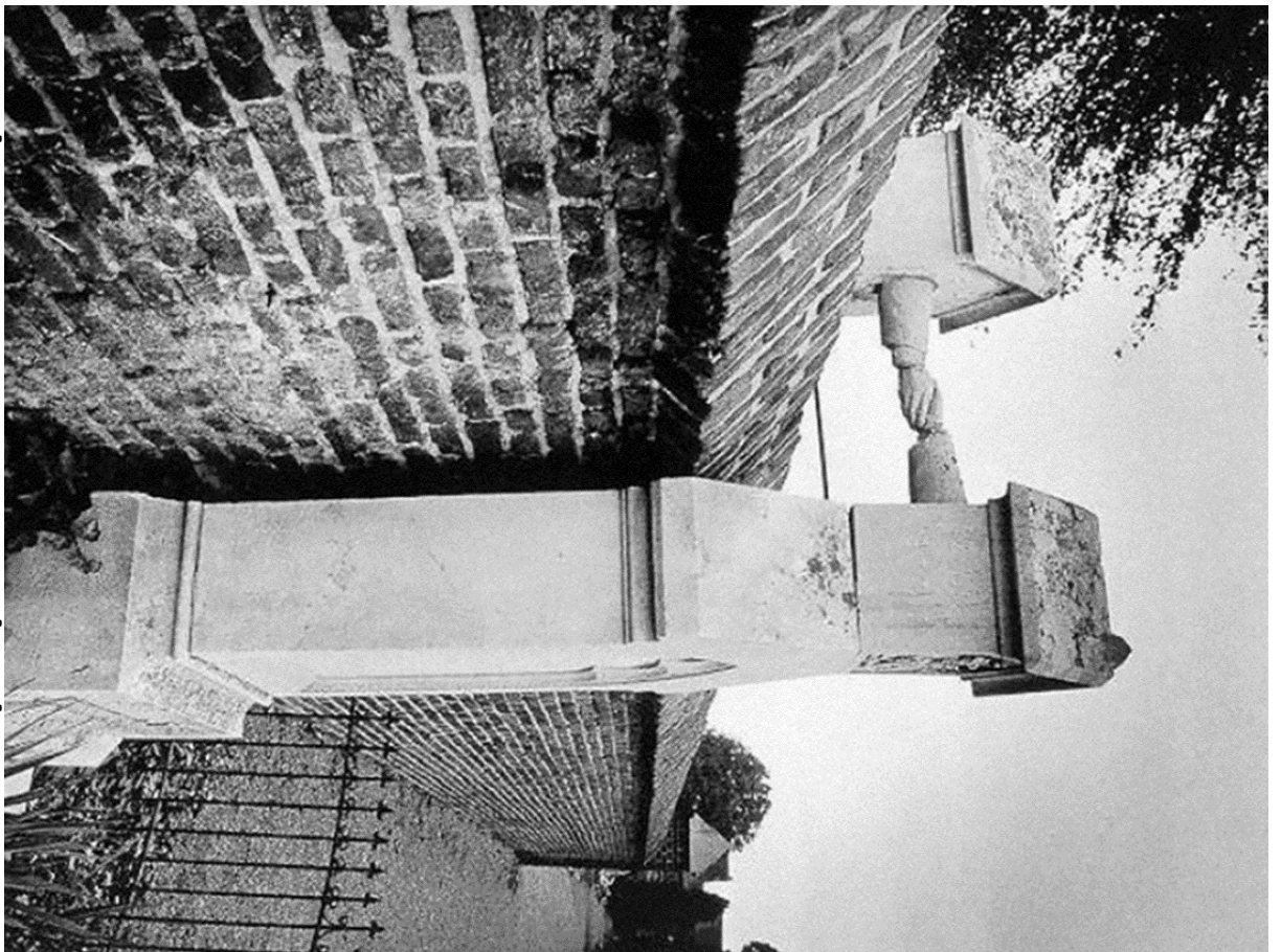
קבריהם של בעל פרוטסטנטי ואשתו הקתולית, הולנד, 1888.