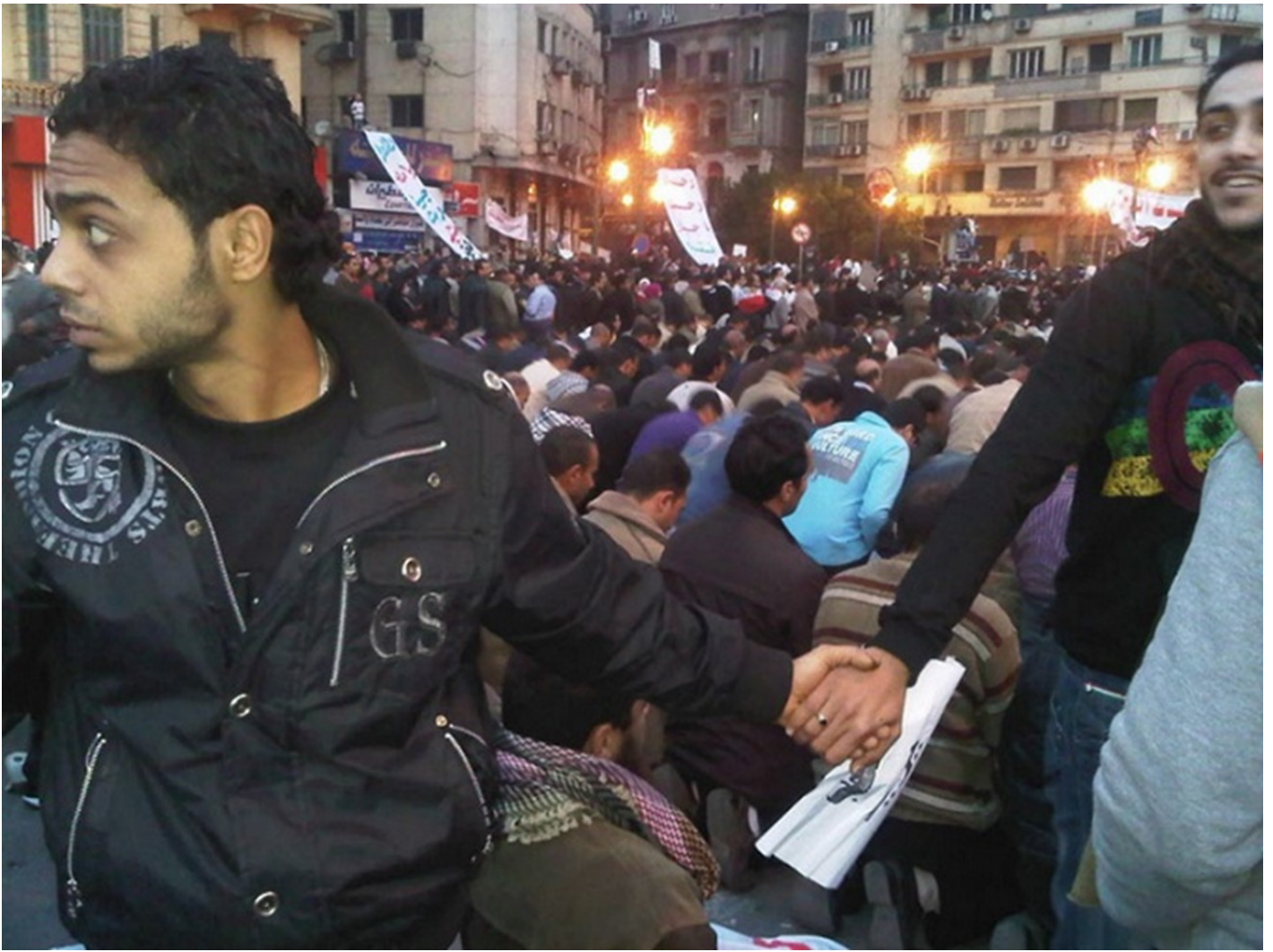
נוצרים שומרים על מוסלמים בזמן תפילה בקהיר, 2011