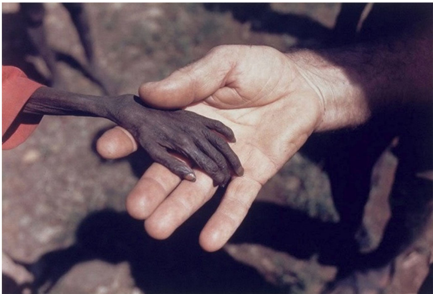
ילד מורעב ומיסיונר