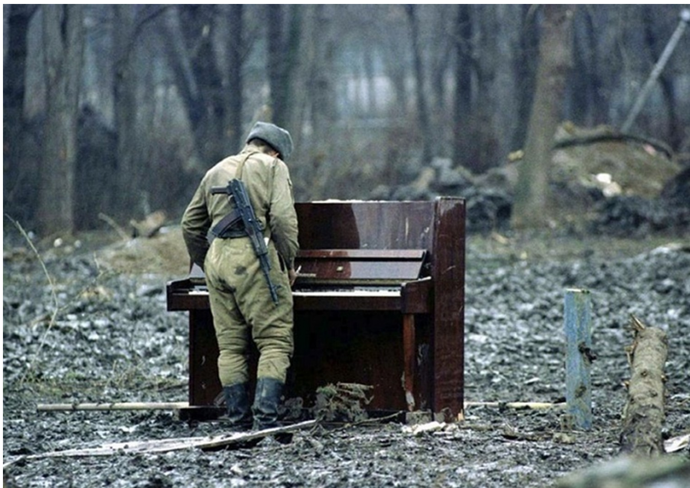
חייל רוסי מנגן על פסנתר נטוש ביערות צ'צ'ניה, 1994.