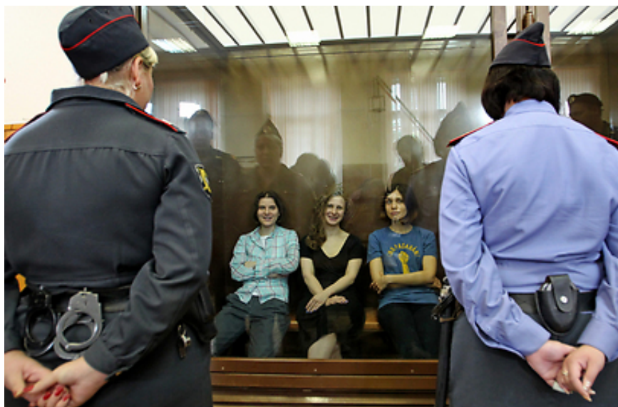
חברות הפוסי ריוט היום בבית המשפט במוסקבה

במסגרת הקראת פסק הדין, השופטת ציטטה את השיר של הלהקה "תפילת הפאנק", אותו ביצעה הלהקה בכנ הכוחה לביצוע הפשע. שלוש הבנות, המוחזקות בזמן המשפט בתא זכוכית סגור, החלו לשיר את השיר בתגו