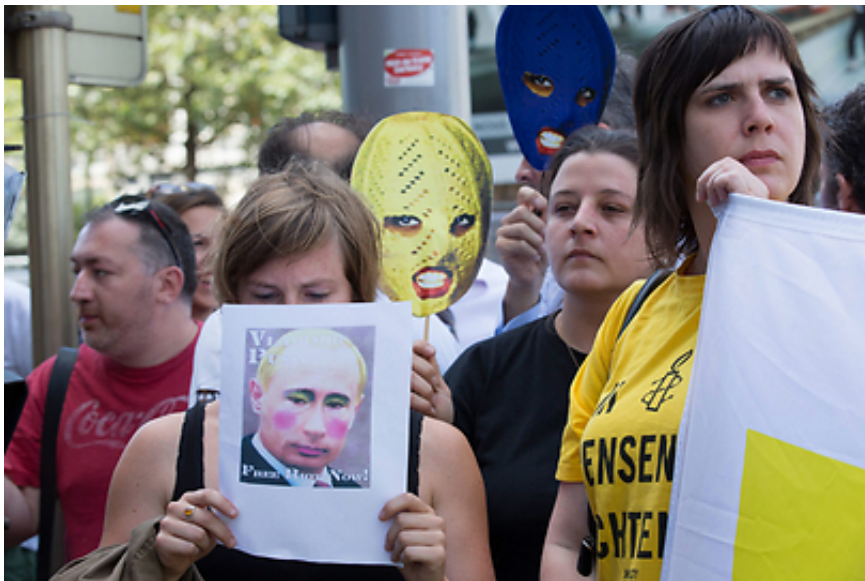
הפגנות תמיכה בלהקה בבלגיה

להקה נוספת שהביעה את תמיכתה בפומבי היתה להקת הרוק האמריקנית " פיית' נו מור ", שגם מצאה לנכון לל לשחרורן של הבנות לביתן. במהלך הופעת הלהקה ברוסיה, אירחו החברים את הבנות האחרות מהפופי ריוט ע וביצעו שיר לכבודן.