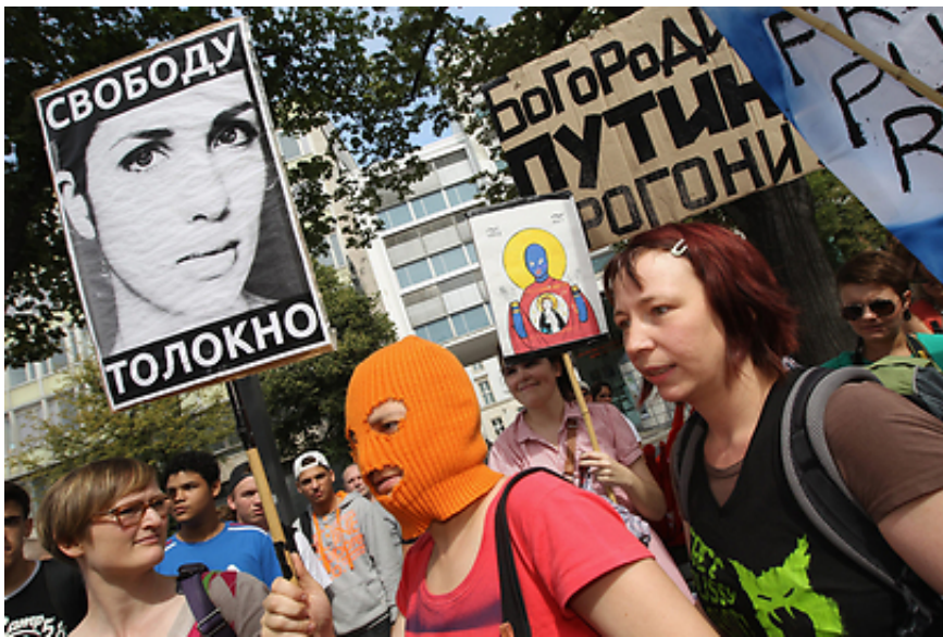
מפגינים בברלין למען הלהקה

אחד הראשונים להגיב לפסק הדין היום (ו') היה הממשל האמריקני. לאחר מתן גזר הדין הוציא משרד החוץ האנ הודעה שבה הוא מכנה את גזר הדין שניתן לבנות הלהקה "חסר פרופרציות", וקורא לרשויות ברוסיה לבחון או מחדש. "ארצות הברית מודאגת מפסק הדין ומהעונשים שניתנו בבית המשפט במוסקבה לחברות הלהקה 'פּוּסִי ומהפגיעה בחופש הביטוי ברוסיה", כתבה דוברת משרד החוץ ויקטוריה נולאנד בהצהרה, "אנחנו קוראים לרשויות ברוסיה לבחון במהרה את המקרה פעם נוספת ולהבטיח שהזכות לחופש הביטוי קיימת".