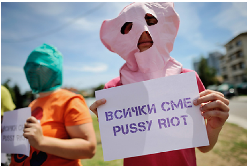
מפגינים עם שלט "כולנו פּוּסִי ריט" מול שגרירות רוסיה בסופיה, בולגריה

חברות הפּוּסִי ריט הן אמנם מוזיקאות בלהקת פאנק בלילות, אבל בימים התמונה היא אחרת. אליוחנה היא סנה רביעית לעיתונות וכתביה יצירתית ומתנדבת של ארגון "גרין פיס" ברוסיה, סמוצ'ביץ' היא מתכנתת מחשב ואליוחנה היא סטודנטית לפילוסופיה. שתיים מהמורשעות הן אימהות לילדים קטנים.