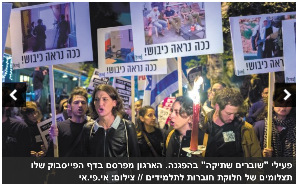
פעילי "שוברים שתיקה" בהפגנה. הארגון מפרסם בדף הפייסבוק שלו תצלומים של חלוקת חוברות לתלמידים

בדצמבר האחרון אסר שר החינוך, נפתלי בנט, על ארגון "שוברים שתיקה" להיכנס לבתי הספר. בנאום בכנסת הסביר בנט שהארגון "מנסה לצייר כנורמה מקרי קצה" שמתרחשים על ידי חיילי צה"ל כלפי פלשתינים, ו"מדובר בארגון שמוציא את דיבתה של ישראל ברחבי העולם. מי שפוגע בצה"ל, במפקדיו ובלוחמיו, ומי שמבקש להשחיר את מדינת ישראל בעולם, לא יהיה בבתי הספר שלנו. ארגון 'שוברים שתיקה' אינו מחנך, אלא מחרב".