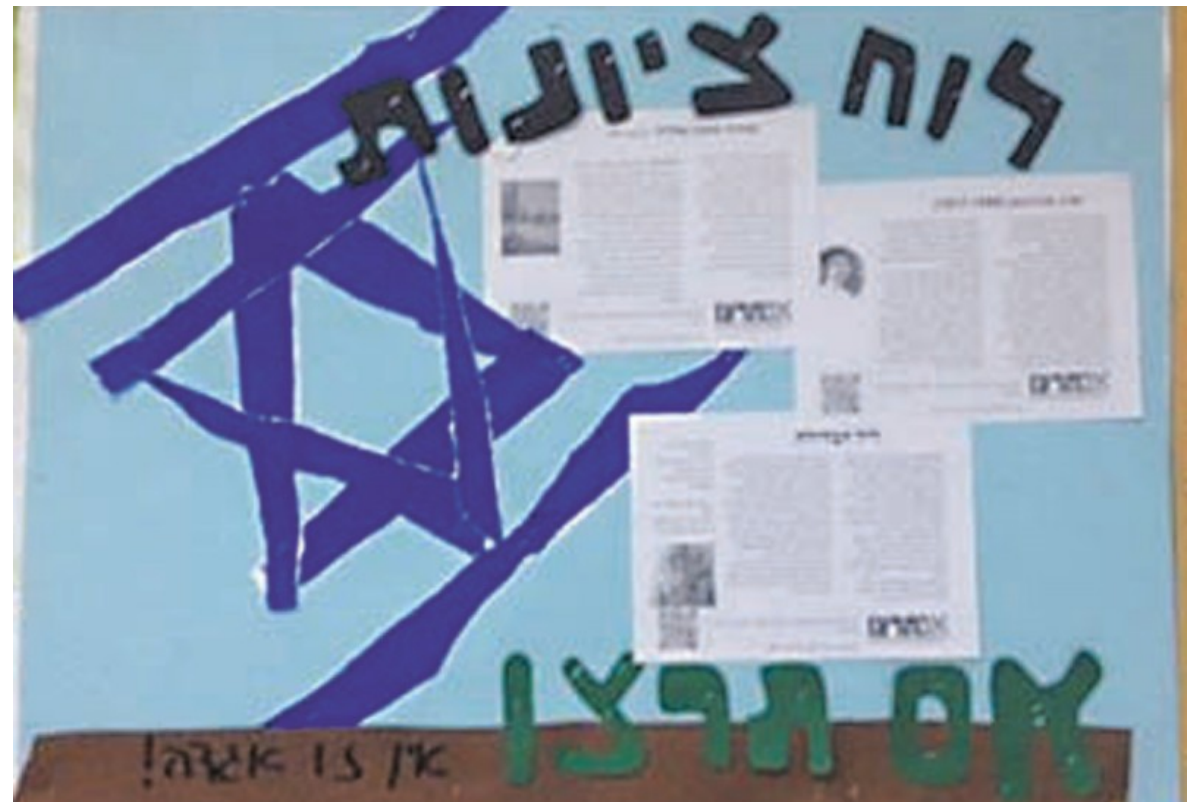
כרזת בביה"ס

מורים שמבקשים לדעת עוד פרטים על הפורום מופנים להשתתף בסדנה, "שבה אנחנו נותנים סידרת הרצאות על מיליטריזם בחינוך, שכוללת תערוכה ובה ייצוגים של מיליטריזם בחיי היום יום בישראל".