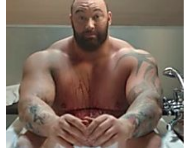
"ההר" שבר את האינטרנט