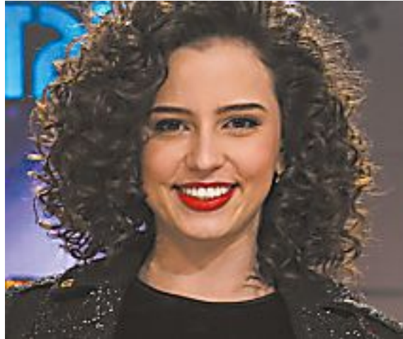
"כן, לקחתי סיכון"