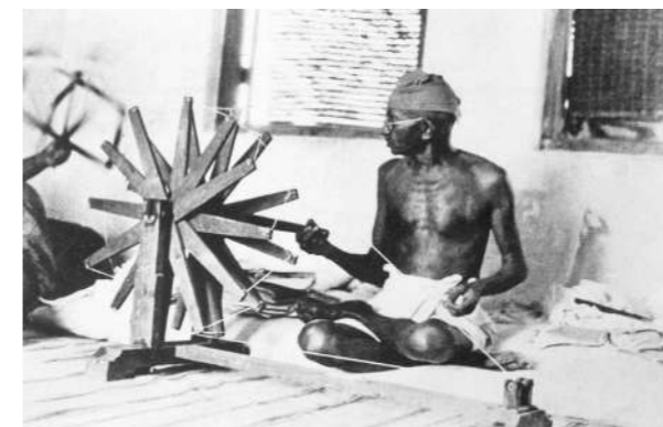
מהמטח גנדי ליד נול הטורוויה