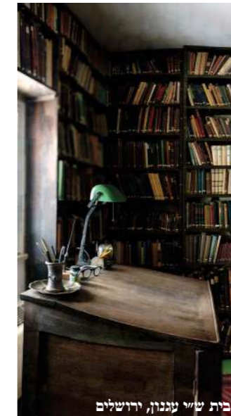
בית ש"י עגנון, ירושלים

במסגרת התוכנית עוסקים העמיתים גם בשיתוף ביוזמות ובעשייה הציבורית שלהם, ומזמינים שיח ביקורתי זה מזה. הדינמיקה המשותפת בין חברי הקבוצה מפרה ומייצרת יוזמות חדשות ושיתופי פעולה. המגוון בו עוסקים העמיתים גדול: חינוך ושינוי חברתי, פי תוח קהילות ויצירות תרבות, וגם מודלים חדשים של עולם הלימוד היהודי. בן דוד: "אצלי לומדים טקסטים מודרניים לצד המסורתיים, וגם את המסורתיים קוראים במגוון אופנים. בעיני זה מהותי. לא הייתי מפחד מהמילה 'להשוות'. כשאומרים 'איך אתה יכול להשוות', אני לא מתרגש. יש הברל בין לומר 'זה שווה לזה' לבין להעמיד אותם