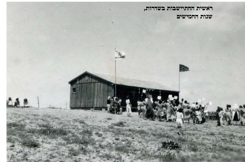
ראשית ההתיישבות בשדרות, שנות המישור

וגיית הפערים בין היהודים שמוצאם מצפון-אפריקה, מתימן ומאסיה לבין אלה שמוצאם בעיקר מאירופה מלי-וזה אותנו מאז קום המדינה ומסרבת לגווע, אך הדיון בנו-שא השתנה לאורך השנים. כיום ישנם לא מעט ישראלים שמבקשים למחוק מהלקסיקון את המושגים "אשכנזים" ו"מזרחים" ולהעלים הבחנות ואפילו על רקע עדתי, כשמנגד יש מי שמתאמר צים לשמר את התרבות המזרחית ולהעלות על סדר היום את השיח המזרחי החדש, שהחליף את השיח הציוני הוותיק.