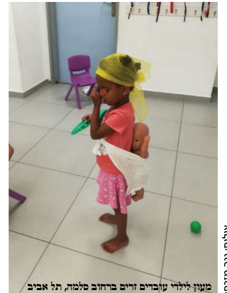
מעון ילדי עובדים זרים ברחוב סלמה, תל אביב

הבעיות הכלכליות, חרדת הגירוש ומצוקת הזרות מקשות על חייהם של העובדים הזרים ומבקשי המקלט בישראל, ופוגעות בסיכויים של ילדיהם – שמרגישים ישראלים לכל דבר – לזכות בחינוך הולם. שלוש נשים החליטו לעשות מעשה, כדי להגשים את חזון החינוך השווה לכל אדם בישראל באשר הוא אדם. "אנחנו צריכות לתת לילדים האלה את הביטחון הבסיסי שלכולנו הוא מובן מאליו", הן מסבירות | קובי ליברמן