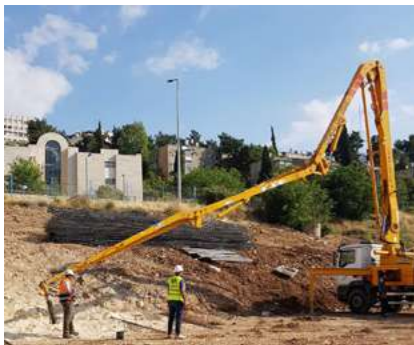
בניית בית הקבע של קרן מנדל בירושלים