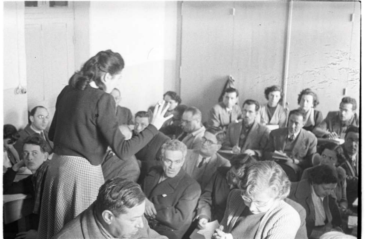
כיתת אולפן בשנות ה-50