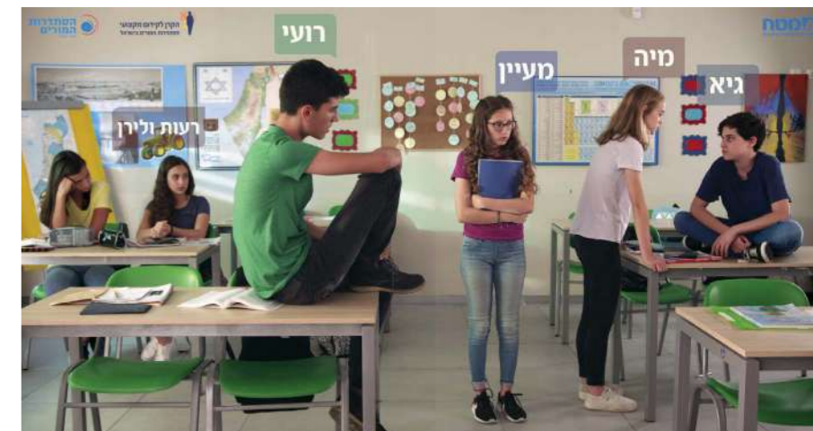
המערכת מתאימה את עצמה ליכולות התלמיד. מתוך סרטון הדרכה של מטח

כאן נכנס לתמונה מטח – אחד הגופים המשפיעים ביותר על מערכת החינוך הישראלית, שמאז הקמתו בתחילת שנות ה-70 הוציא לאור מעל 1,400 ספרים מודפסים ומעל 1,000 ספרי דיגיטליים, וכן פיתח ובנה מאות אתרי אינטרנט והכשיר עשרות אלפי מורים. “במרבית המדינות המערביות המורים נמדדים בהספק התוכן שאותו הם הצליחו ללמד”, מסביר לוי, בוגר בית ספר מנרל למנהיגות חינוכית ואחד מתשעת בוגריו שנמצאים בעמדות מרכזיות במטח. “לעומת זאת, יש מדינות – כמו פינלנד ושבדיה – שבהן אין עומס של נושאי לימוד,