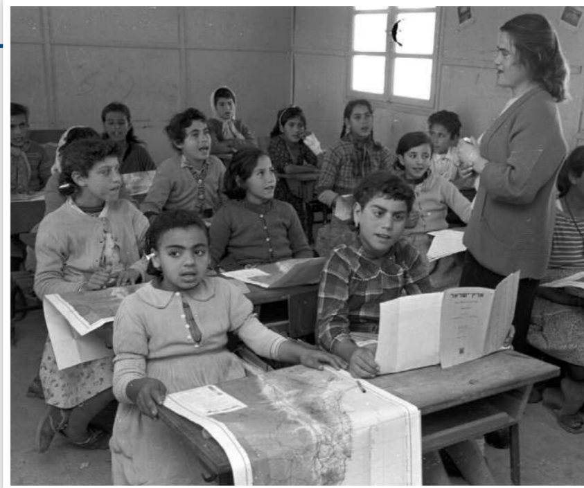
ביתה במעברה בשנות ה-50

"אתה לא יכול לצפות ממני להיות ישרה ולא להעתיק ולוותר על עשר בבגרות, כאשר הברים שלי מעתיקים, משיגים עשר ומקדמים