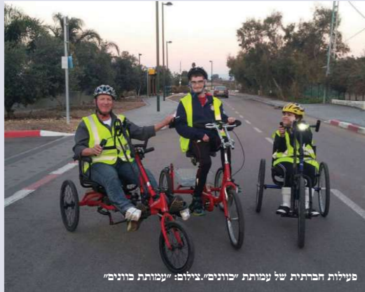
פעילות חברתית של עמותת "כוונים".