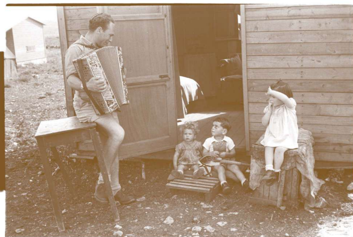
נגן אקורדיון מנגן לילדים, בקיבוץ לביא 1950

כשעומדים לצידם, הלב לא רק מתרחב, הוא גם מתמלא תקווה שנצליח לעמוד במשימה הזו. שיהי, נוכל ליצור חברה ישראלית אחת, חזקה, חולמת ושועתת קדימה, שיש בה מערכות חינוך נפרדות, אבל גשרים רחבים ואיתנים מחברים ביניהן.