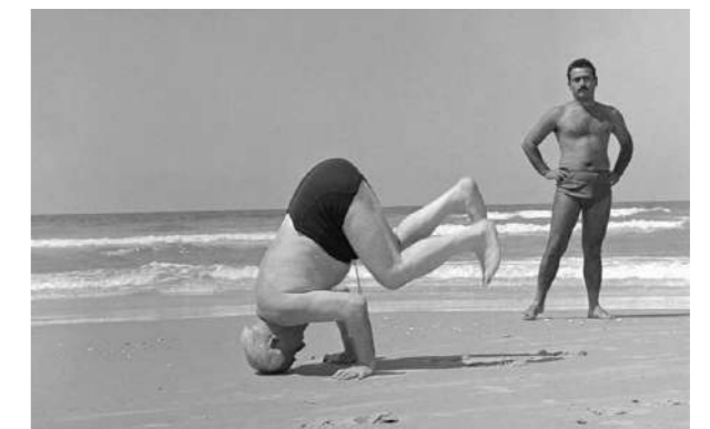
בן-גוריון עומד על הראש