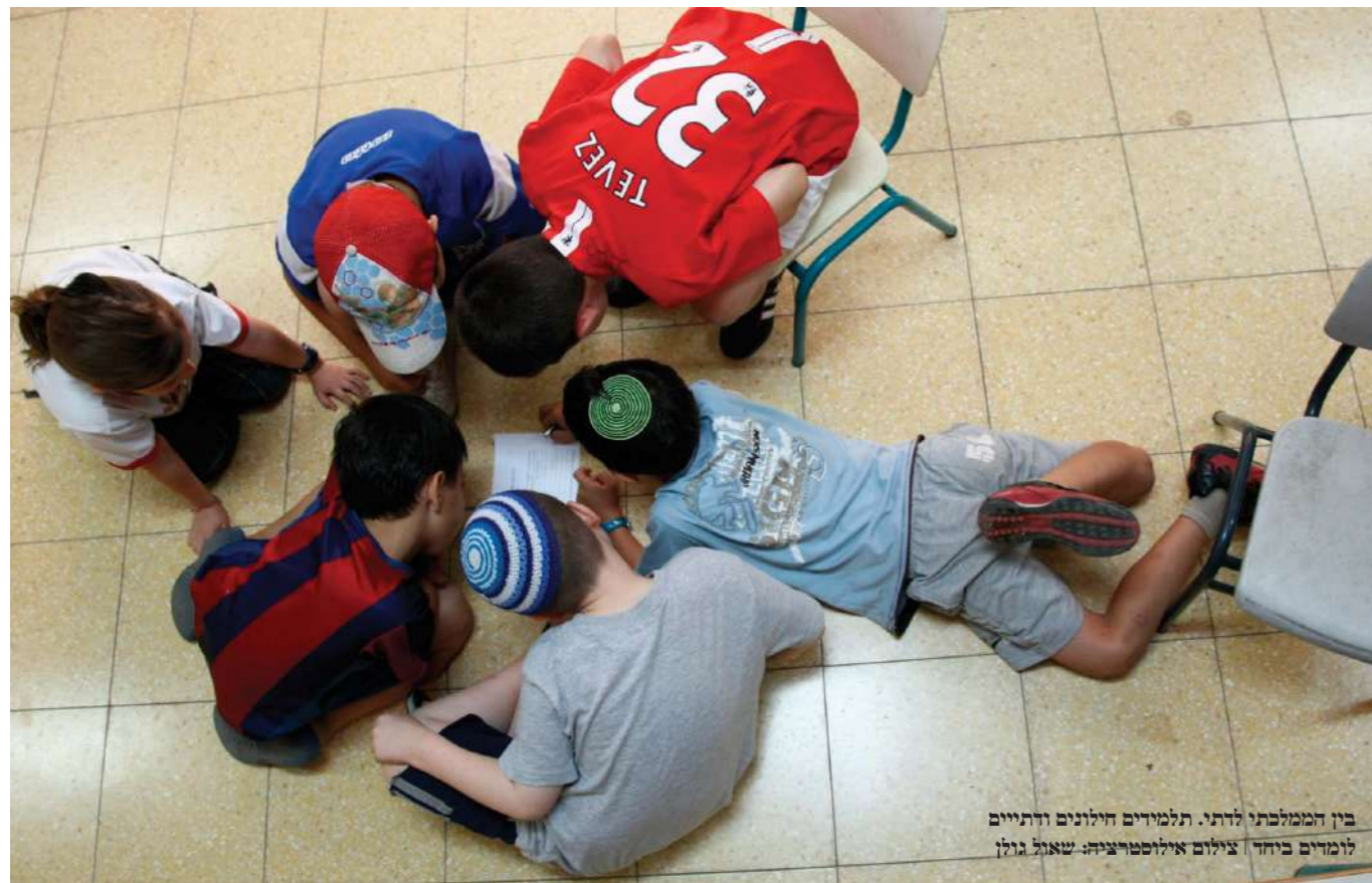
בין הממלכתי לדתי. תלמידים חילוניים ודתיים לומדים ביחד