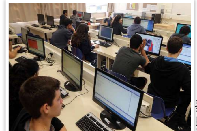
ביתת מחשבים בשנות ה-2000

וכך מתברר עד מהרה כי מה שאנו חושבים עליו כמובן מאליו, על