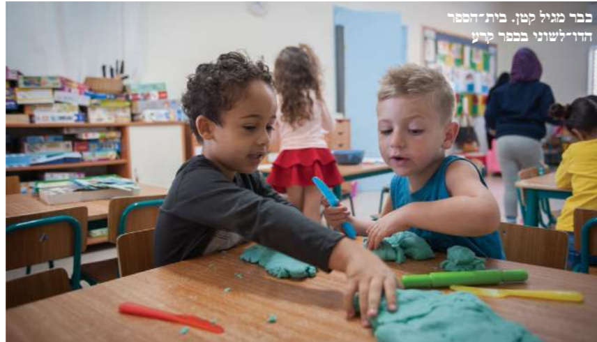
כבר מגיל קטן. בית הספר הדו-לשוני בכפר קרע

באוירה של היום בית ספר דו-לשוני יכול להישמע כמו בועה, בייחוד בירושלים. "אני לא מוכן לקבל את ההגדרה בועה - אני מעדיף חממה. חממה זה מקום שמצמיח, שנותן לתנאי החוץ להיכנס פנימה בתנאים מבוקרים. כשצמח גדל בחממה, יוצאים ושותלים אותו בעיר. אנחנו לא מתעלמים מהחוץ, אנחנו עושים את זה בצורה שמאפשרת שיח בין אנשים. יש יותר שיח אצלנו מאשר בבתי הספר הדו-לשוניים, דווקא בגלל המגוון. אני חושב שהמניע הראשוני של ההורים לרשום את הילדים שלהם לבית הספר הוא שונה. באוכלוסייה הערבית המניע הוא בעיקר הרצון להשתלב בחברה הישראלית, ואצל היהודים הרגש הוא על חיים משותפים והיכרות עם האחר".