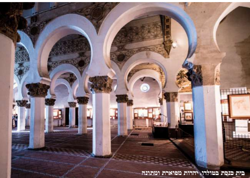
בית מנחת בטולדו, יהדות מפורצת ומתונה