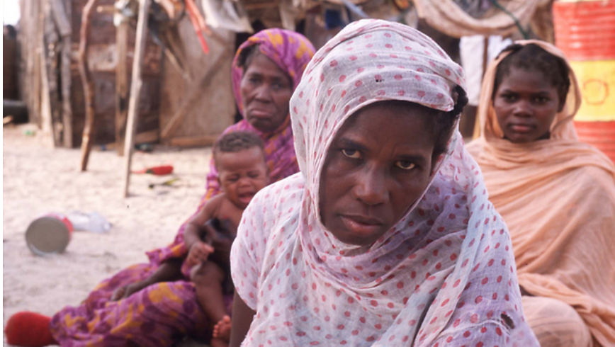
151 אלף עבדים במאוריטניה

הצגת השינויים חלה כשברקע נושף בעורפה של ממשלת מאוריטניה תאריך היעד שהגדירה יחד עם האו"ם למיגור התופעה. עד שנת 2016 אמורה התופעה כמעט להיעלם במסגרת מפת הדרכים שהוסכמה בין הצדדים, הכוללת 29 המלצות המכסות את ההבטים הכלכליים, החברתיים, המשפטיים והחינוכיים של התופעה.