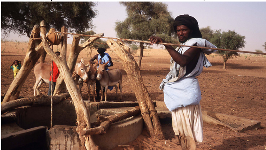
התלונה על המשעבד לרוב לא מתגלגלת לכדי כתב אישום

הרשויות טוענות כי מדובר בתנועה אסורה שמנסה להצית מרי אזרחי נגד השלטון, ומאבקה המופנה בעיקר נגד השלטון מחזק את היד הקלה על ההדק גם כך נגד פעיליה. בנובמבר 2014 ארגן עבייד עם עמיתיו לתנועה שיירת מחאה בדרום המדינה, ובמהלכה פרצו עימותים אלימים עם כוחות הביטחון והוא וחבריו נעצרו.