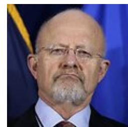
ראש סוכנות המודיעין הלאומי ג'יימס קלאפר

בממשל ובמודיעין האמריקני הביעו דאגה חמורה מנזקים לביטחון המדינה כתוצאה מהדלפת תוכניות הציתות הסודיות, שלפיה הממשל ריגל אחר טלפונים של מיליוני אזרחים וגם דרך שירותי האינטרנט והרשתות החברתיות.