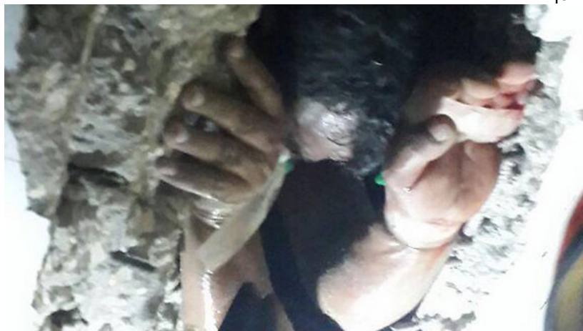
מנסים להגיע ללכודים בהריסות המבנה שקרס

לאור ריבוי מקרי המוות של פועלי בניין ולחץ תקשורתי, בשנה האחרונה עסקה ועדת העבודה והרווחה של הכנסת בנושא בסדרה של דיונים. בסוף מושב הקיץ אישרה הכנסת הצעת חוק של יו"ר הוועדה ח"כ אלי אלאלוף (כולנו), בן ראובן ועבד אל-חכים חאג' יחיא (הרשימה המשותפת), לפיה אתר בנייה שאירעה בו תאונת עבודה קשה ייסגר למשך יומיים.