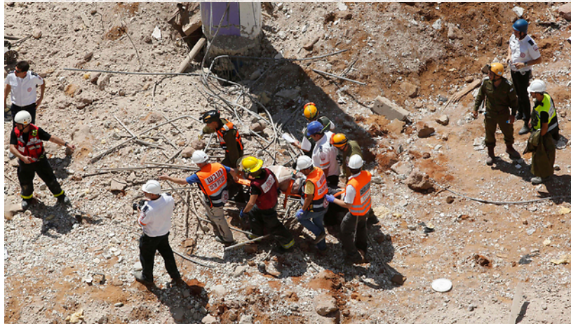
פינוי פצועים מאתר הקריסה ברמת החייל

למרות הנתונים הקשים האלו, בישראל פועלים 17 מפקחים בלבד מטעם מנהל הבטיחות, שעבר מאחריות משרד הכלכלה לאחריות משרד העבודה והרווחה בחודש שעבר. עובדים אלו מפקחים על כ-13 אלף אתרי בנייה הקיימים בישראל. לפי דו"ח של מרכז המחקר והמידע של הכנסת, כ-52% מהאתרים כלל לא נבדקו על ידי הפקחים.