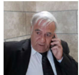
נפאע בבית המשפט, הבוקר