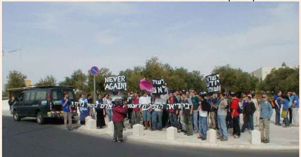
ערב יום השואה, הפגנה בירושלים. מניפים כרזות ומחתימים על עצומה

אולם אולי המעניינת והרלוונטית ביותר עבור הקורא הישראלי היא ההתארגנות הישראלית של " הוועד היהודי-ישראלי נגד תאי הגזים בצפון-קוריאה ". הוועד הוא ארגון התנדבותי, תוצר שיתוף הפעולה של תנועות נוער ואנשים פרטיים, שמסרב להניח לנושא זוועות צפון-קוריאה להישכח מסדר היום. אתר הוועד מלקט כתבות, מאמרים וקישורים בנושא, ומזמין כל הרוצה בכך לקחת חלק בפעילות המחאה. פעילות זו כללה עד כה שלוש הפגנות שסוקרו (בצמצום) על-ידי התקשורת, עצומה המונה כ-10,000 חתימות אשר הוגשה לכנסת ולפקיד בכיר במשרד-החוץ האמון על אזור מזרח-אסיה.