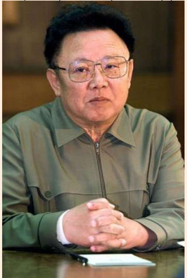
מנהיג צפון-קוריאה - קים ז'ונג-איל

העריק שצוטט, קוון היוק, שימש כאחראי על המנהלה במחנה 22, ומאוחר יותר היה הנספח הצבאי בשגרירות צפון-קוריאה בבייג'ין. לאחר שערק לדרום-קוריאה, הוא מבקש לחשוף לעולם את המתרחש במחנה.