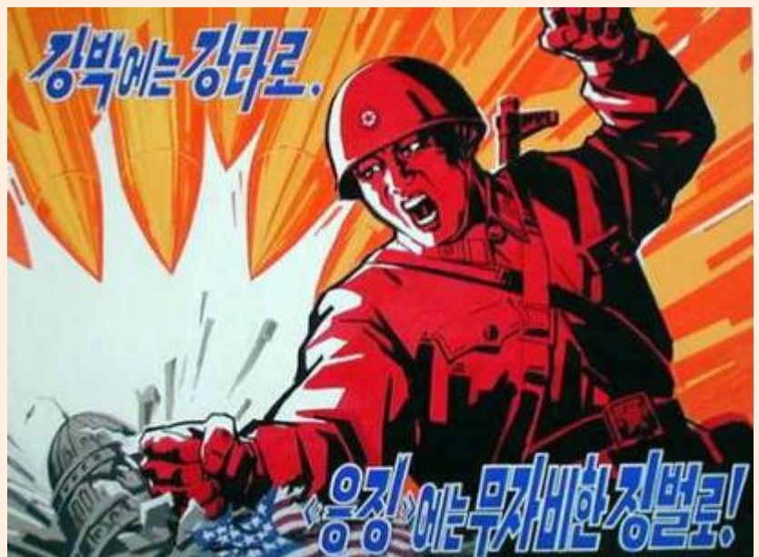
כרזת תעמולה צפון-קוריאנית

מן ההגינות לומר שמדובר במספר מועט בלבד של עדויות, וקיימת עמימות רבה לגבי הנעשה בצפון-קוריאה בכלל ובמחנות בפרט, אולם יהיה זה אף נאות לציין שצפון-קוריאה הינה אחת המדינות המסוגרות ביותר בעולם, כמעט ללא קשרים דיפלומטיים עם מדינות אחרות, ללא גישה חופשית לאינטרנט או למבקרים זרים, מדינה המרחימה ומפגינה תוקפנות כלפי מרבית העולם המערבי, וכל פיסת מידע ממנה היא יקרת-מציאות.