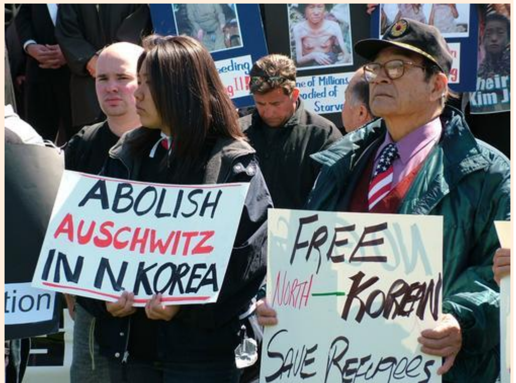
עצרת מחאה בווישינגטון מול מוזיאון השואה