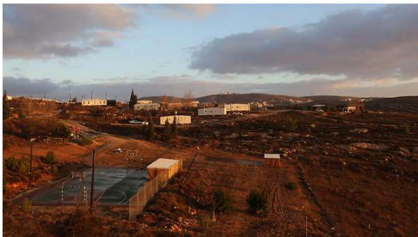
עמונה. מתכוננים לפינוי