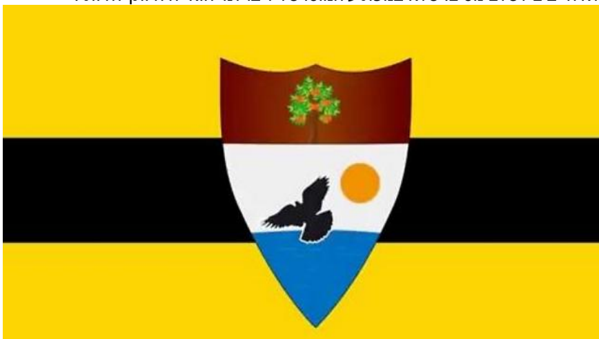
הדגל של ליברלנד

למרות ההסתייגות בצ'כיה, ג'דליקה אומר שניסיונותיו להקים ארץ חדשה כנים לחלוטין. "המטרה של מייסדי המדינה החדשה היא להקים ארץ שבה אנשים ישרים יכולים לפרוח מבלי להיות מדוכאים על ידי ממשלות שהופכות את חייהם לבלתי נעימים, באמצעות נטל של הגבלות שאין בהן צורך ומסים", נכתב בהודעת ההקמה של ליברלנד, שבה אין צבא ולא חייבים לשלם מסים. שלא במפתיע המוטו של ליברלנד הוא "חיה ותן לחיות".