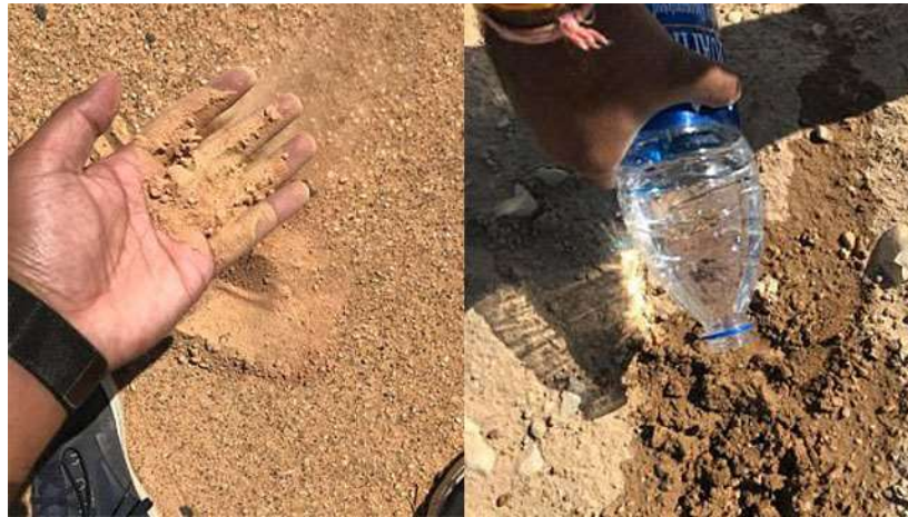
דיקסיט זורע באדמה

דיקסיט מכיר בכך שהוא לא הראשון שמכריז על מדינה לכאורה בשטח השומם. "אני יודע שהיו בין חמישה לעשרה אנשים שעשו את זה בעבר, אבל זה השטח שלי עכשיו – אם הם רוצים לחזור, תהיה מלחמה (כנראה על כוס קפה מ'סטארבאקס)!", כתב. "אני המלך! זאת לא בדיחה. יש לי מדינה עכשיו! הגיע הזמן לשלוח מייל לאו"ם".