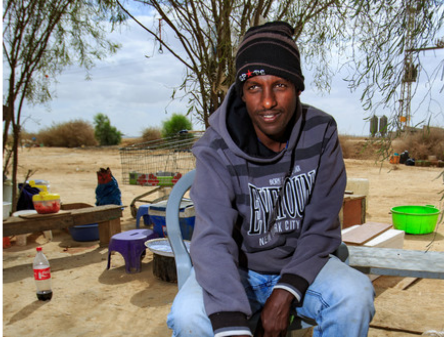
מחוץ לחולות. ריח תבשילים, קפה ונרגילות

הסוהרים. הם מתלוננים על אמירות גסות ומזלזלות כמו "מבחינתנו כולכם אותו דבר", על המתנה ממושכת לתשובה לבקשותיהם, על מזון רע שניתן בכמויות קטנות, על ריחות רעים שמגיעים מהרפת ומהלול הסמוכים ומפריעים לישון, ועל תנאים אישיים ירודים. ומעל לכל מרחף חוסר המעש, חוסר התחלת שבשהות במקום הזה.