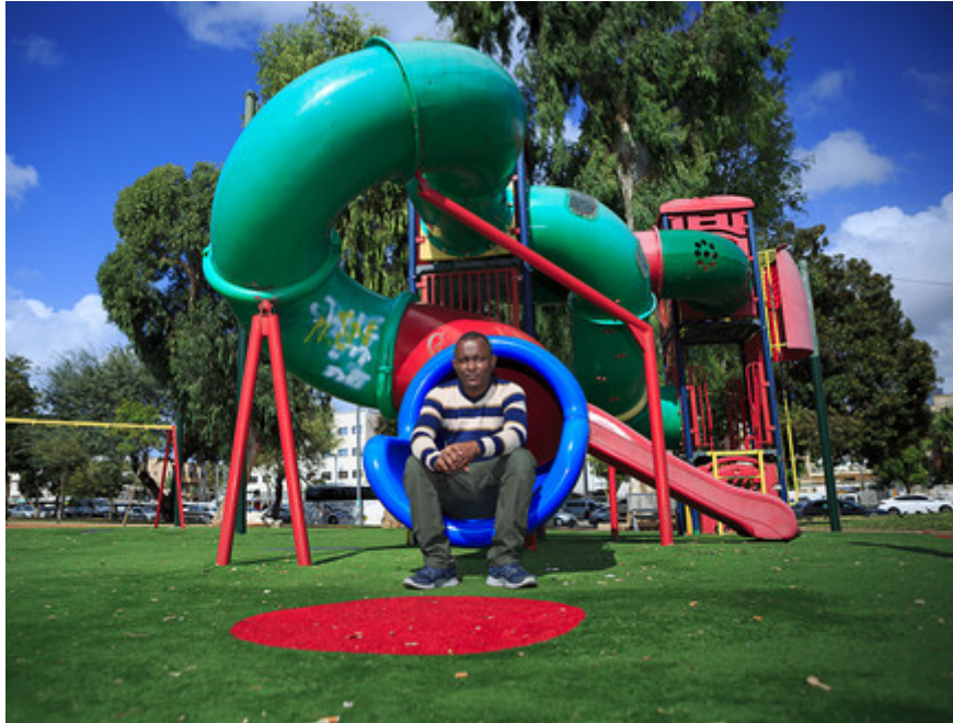
"חולות זה מקום שבו אתה אמור לאבד תקווה, ויש כאלה שמשתגעים". בולוס בגינה הציבורית ליד דירתו

"ישראל לא שמה עליך אזיקים, היא לא מכריחה אותך, היא מנסה לגרום לך לעזוב בדרך עקיפה", הוא אומר, "זה הפתיע אותי, כי ידעתי על מה שהיהודים עברו. השנה בחולות ייאשה אותי, אבל גם חיזקה. עשיתי הכל כדי להישאר בן אדם: רצתי כל בוקר, קראתי, לימדתי, דאגתי לחברים שלי. אחרי כל מה שעברנו כדי לחיות, שנה בחולות זה משהו שמתמודדים איתו".