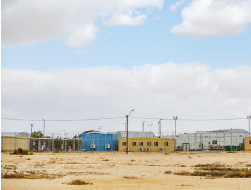
חולות. במדינה מסבירים שהמטרה היא למנוע מהמסתננים להשתקע

אז מה המטרה? המדינה לא ממש מסתירה אותה: מבחינתה מדובר במסתננים שיש למנוע מהם להשתקע בישראל, וצריך לגרום לאוכלוסיה הזאת, שהיקפה מוערך כיום ב-40 אלף איש, לחזור כולה לאפריקה. "עד שתהיה לי אפשרות לגרש אותם, אני אכלא אותם כדי להמאיס עליהם את חייהם", אמר ב-2012 שר הפנים דאז, אלי ישי. מחליפו בתפקיד גדעון סער, שבימיו הוקם חולות, אמר דברים דומים בשפה קורקטית יותר: "אחד השיקולים הדומיננטיים בהכנסת אנשים למתקן הוא אופק הרחקה". במקביל הגיעה ישראל להסכמים עם רואנדה ואוגנדה כדי שיקלטו את מי שיסכימו לעזוב.