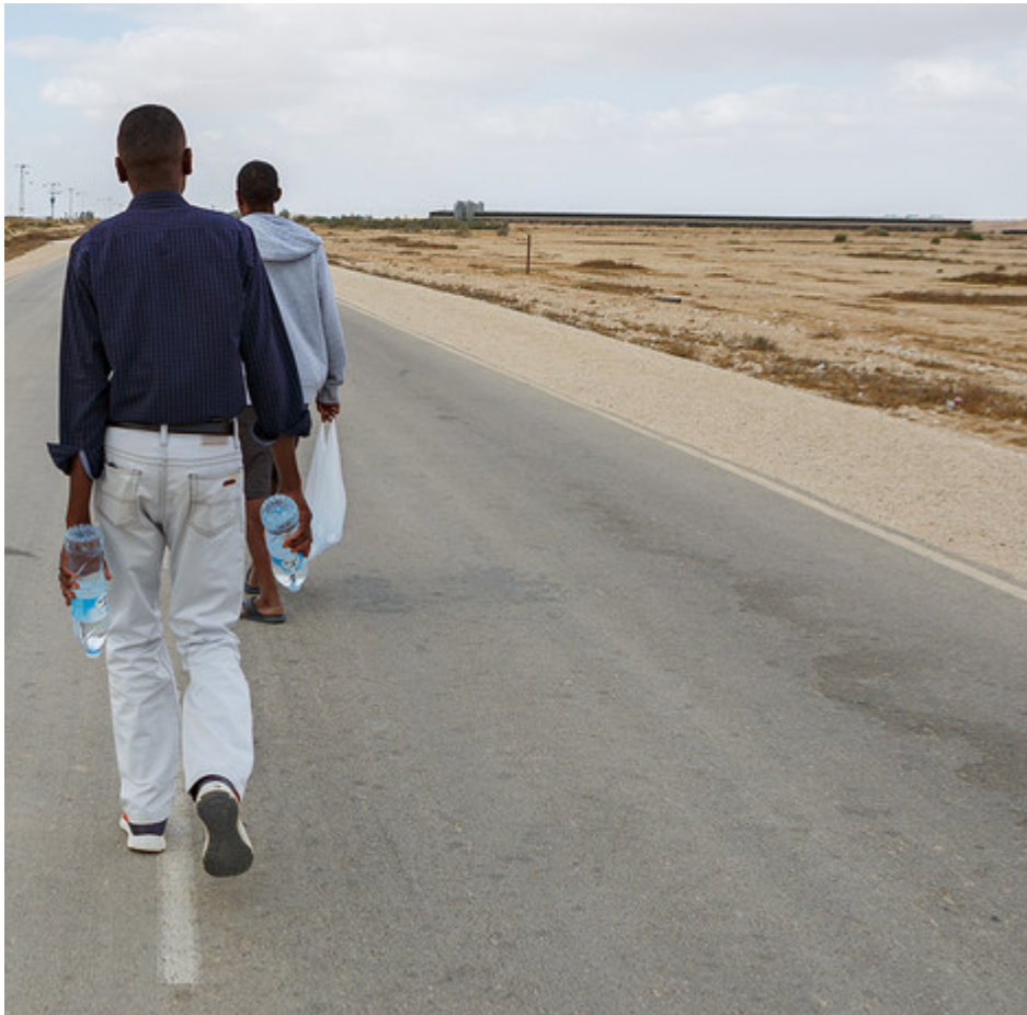
כביש הגישה לחולות. פתרון ביניים שנשכח באמצע הנגב

יאנה פבזנר בשן | מגזין mako | פורסם 10:27 10/11/16