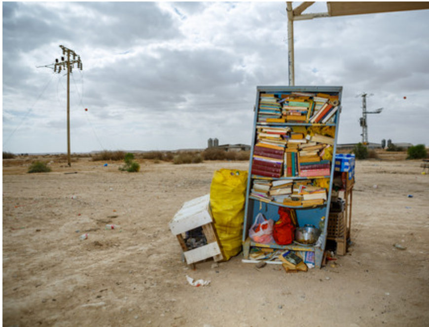
ספריה עירונית מאולתרת בחולות. ספרי לימוד עברית הם המבוקשים ביותר

"כשהם יוצאים משם אסור להם להגיע לתל אביב ואילת, והם נאלצים להגיע למקומות שבהם לא היו קודם. רבים מהם הולכים לשכונות שכמו דרום תל אביב הן חלשות יחסית, ושם גרים חברים שלהם שנותנים להם קורת גג. הם מתחילים מאפס במצב הרבה יותר קשה, בחלק מהמקרים הם עשרה בדירה אחת. בשכונות האלה יקרה מה שקרה בדרום תל אביב: הן פשוט לא ערוכות לקלוט מספר כל כך גדול של אנשים. זה גורם לעומס אדיר על מערכות המים והאשפה, ובחורף הרחובות יהפכו לוונציה של ביוב. לא בגלל אופי האוכלוסיה, בגלל העומס והצפיפות".