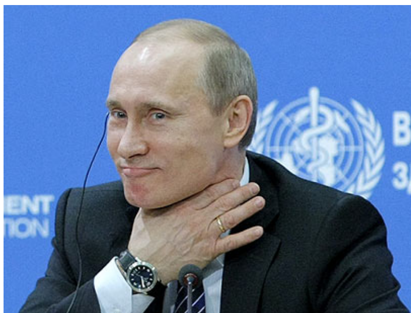
"פוטין יקבל רבע מיליון קולות מזויפים"

אחרי הזיזים שהתגלו בבחירות לפרלמנט בסוף השנה החולפת, אמר פוטין כי דרש להציב מצלמות וידאו , 24 שעות ביממה, בכל הקלפיות בבחירות לנשיאות, על-מנת למנוע זיופים. אולם, התחקיר שפורסם ביום מגלה כי צד אנשיו של פוטין נערכו מבעוד מועד כדי להוביל לכאורה הונאה המונית.